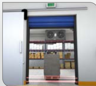
4 fotocélulas de seguridad para un funcionamiento seguro en ambientes de temperaturas negativas