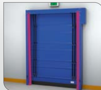
Las guías flexibles TRAFICONTROL proporcionan un sellado óptimo de la cortina y permiten su expulsión en caso de impacto