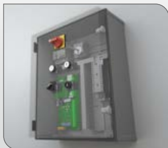
Tablero remoto IP65* situado fuera de la cámara frigorífica, lado positivo