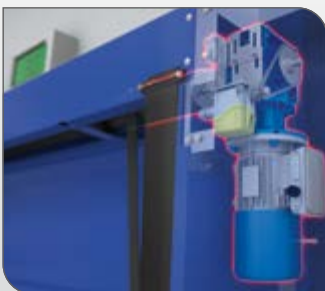
Motor con aceite para frío extremo funciona hasta -30°C