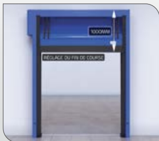
Final de carrera electrónico para un ajuste simplificado y optimizado a media altura